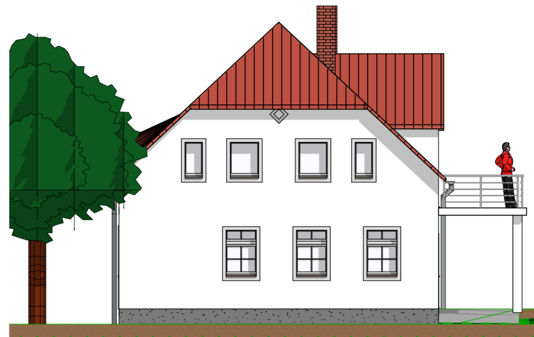
Ansicht Nord 1:100