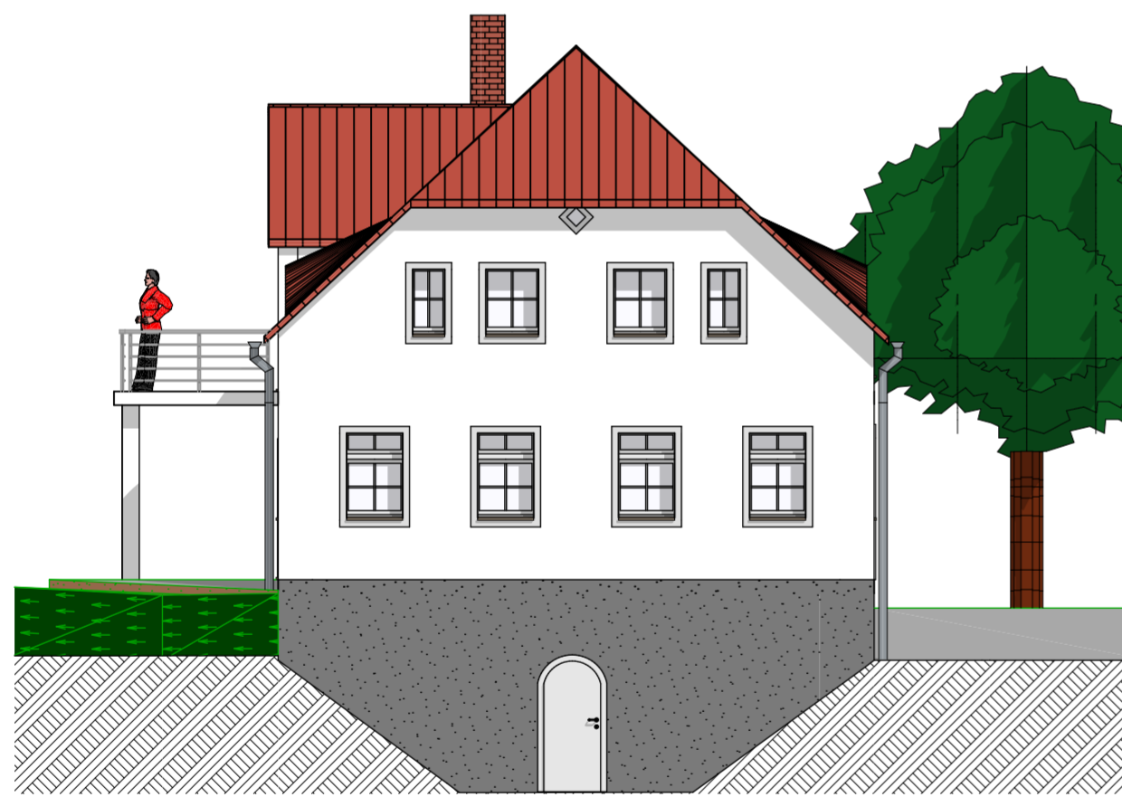
Ansicht Süd 1:100